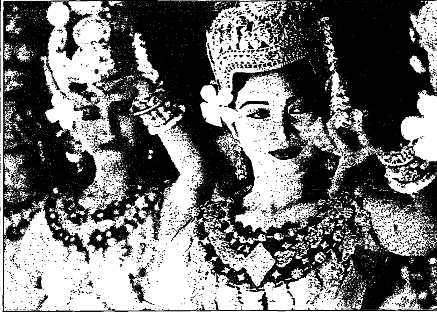
بمناسبة أول مهرجان سينمائي دولي يقام في كبرياء قدمت فرقة الباليه الوطني عرضاً في القصر الملكي بالعاصمة بدموم بنه، أمس الأول.

الشارقة (الإمارات) - في عيد أعلنت شرطة الشارقة أمس الأحد أنها منعت من إلقاء القبض على شاين اغتصبا وقتلا طفلة باكستانية في العاهرة من عمرها في تشرين الأول (أكتوبر) الماضي.